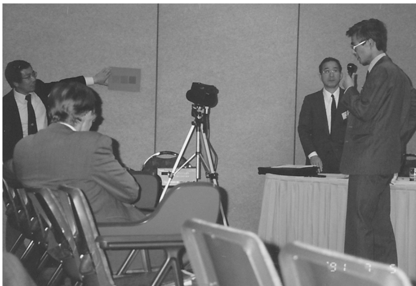
図4 CIEメルボルン大会で公開した薄明視ブライトネスメーターのデモ風景

開発後まもなく、1991年オーストラリアのメルボルンでCIEの本大会があった。薄明視の委員会は引き続き、CIEとしてどの提案が良いかを検討していた。ここで開発したブライトネスメーターを