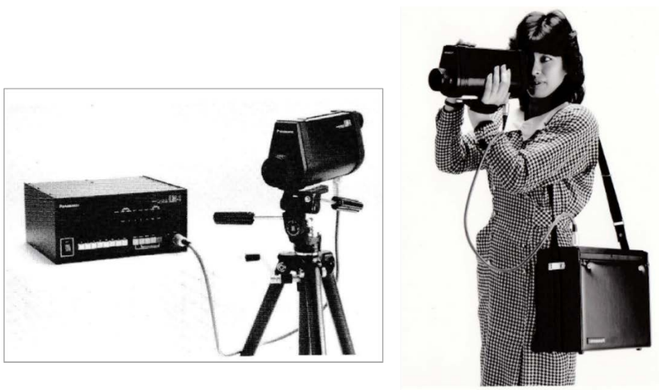
図3 薄明視ブライツネスメーター。左は計測部と表示部、右は持ち運びながら計測する様子。

薄明視の測光システム作りは、研究としては最も重要な部分で、いろいろな知恵を絞り工夫も凝らすので面白いのではあるが、前述したように、なかなかどれが優れているかの評価が、定性的にも定量的にも難しい。分野の異なる人々にとっては細かい話になるので、詳細は割愛するが、とにかく、世界中の測光に関係する人々がいろいろな知恵を絞って工夫してみても、CIE として推奨できる一つの優れたシステムはなかなか出てこなかった。逆に言えば、どの提案システムも優れており、似たり寄ったりというところ。