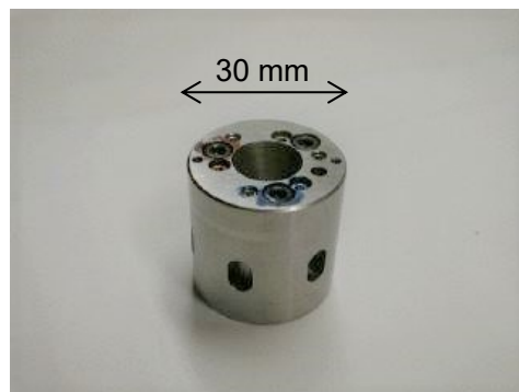
図3 超高圧下の赤外振動スペクトル測定に使用した小型 DAC。