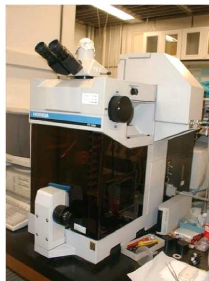
図2 超高圧下の赤外振動スペクトル測定に使用した顕微赤外分光器。

氷は対向するダイヤモンドアンビル間で加圧され、赤外スペクトルはダイヤモンドアンビルを通して測定される。良質な赤外スペクトルを測定するためには不純物を含まない高純度のダイヤモンドアンビルが必要不可欠であり、窒素フリーのタイプ-IIa ダイヤモンドを使用した。ダイヤモンド中に窒素が僅